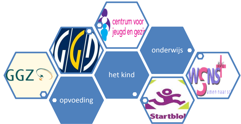
Afbeelding 2 – Verclustering van verschillende zorginstellingen

Sleutelwoorden in de problemen die hierboven worden blootgelegd zijn overdracht en coördinatie, je zou het ook kunnen samenvatten in één woord: communicatie. Omdat het aanbieden van goede zorg voor leerlingen met speciale onderwijs- of opvoedingsbehoefte enorm gedifferentieerd is, is goede communicatie een essentieel punt. Momenteel merk je dat elke instelling ontzettend hard bezig is met de kwaliteit van de zorg, maar er wordt vergeten om naar elkaar te kijken. De oprichting van de Centra voor Jeugd en Gezin is een goede stap in de richting, maar het is jammer dat daar de focus ligt op opvoeding en dat de koppeling met de professionals van het onderwijs nauwelijks gemaakt wordt. In de zorg rondom het onderwijs is er veel ondersteuning rond de school, maar blijft de school verantwoordelijk voor het onderwijs- en zorg aanbod. De coördinerende rol wordt dan vaak bij de IB-er neergelegd.